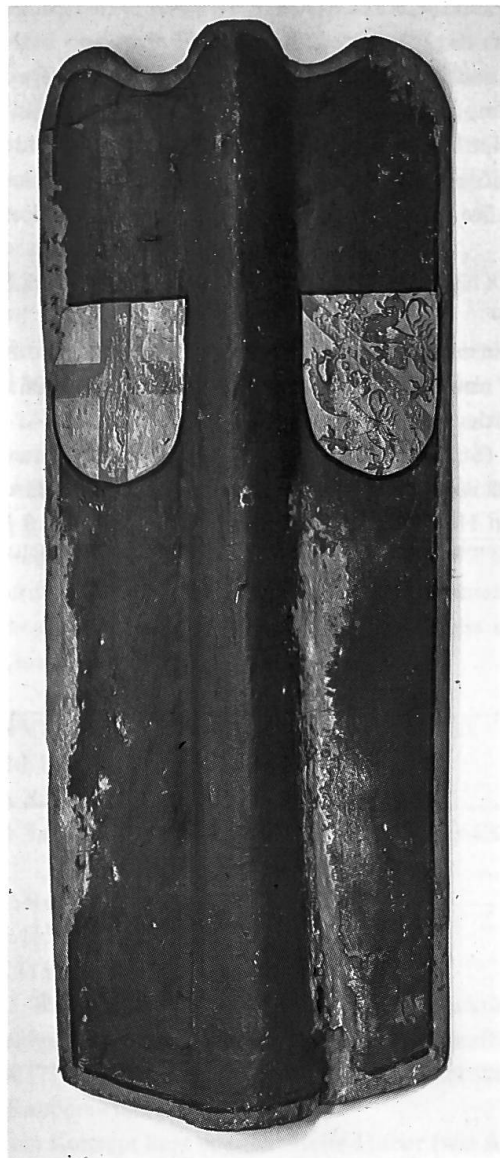
Abb.28: Eine Stadt sucht Schutz: Schild aus der 1. Hälfte des 15. Jahrhunderts mit den Wappen von Winterthur und der Adelsgesellschaft St. Jörgenschild; wohl aus dem Alten Zürichkrieg, als süddeutsche Adlige zur Besatzung Winterthurs zählten.