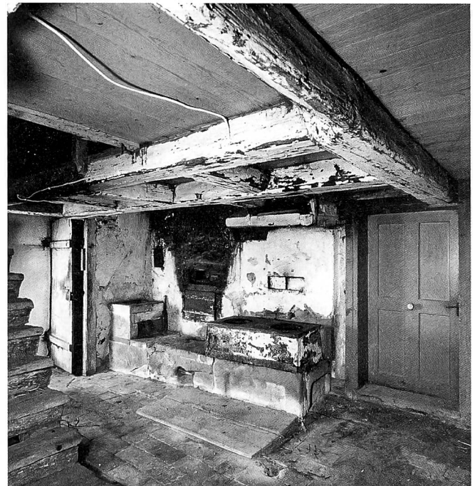
Das Gebäude aus dem 17. Jahrhundert wurde 1739 zu einem Doppelbauernhaus erweitert. Links und rechts der Eingangstüre gegen die Strasse liegen die beiden Stuben, darunter die je durch einen Abgang erschlossenen Keller. Gut erhalten ist die Küche mit offenem Rauchfang im westlichen Hausteil.