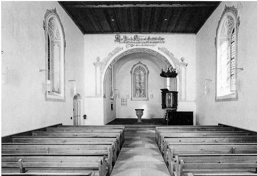
1667 an idyllischer Lage erbaut, zeigt sich die Kirche Aeuget seit der Renovation von 1967 mit den dekorativen Malereien und Bibelzitatien wieder als stimmungsvoller frühbarocker Raum.