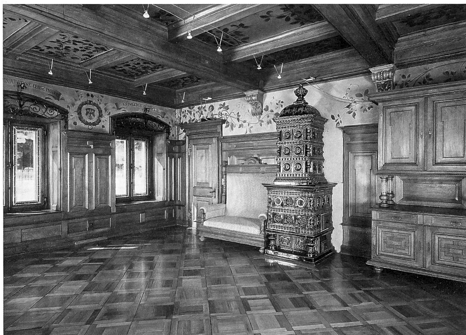
Das «Neuthal» um 1840. Links das Fabrikgebäude mit Verbindungsbau im ersten Obergeschoss zum Fabrikantenwohnhaus, rechts das Ökonomiegebäude. Im Hintergrund leitet das Aquädukt Wasser auf die beiden grossen Wasserräder, im Vordergrund der untere Park mit Gartenanlage. (Repro in der «Gedenkausstellung Adolf Guyer-Zeller – Leben und Werk 1838–1899» in Neuthal)