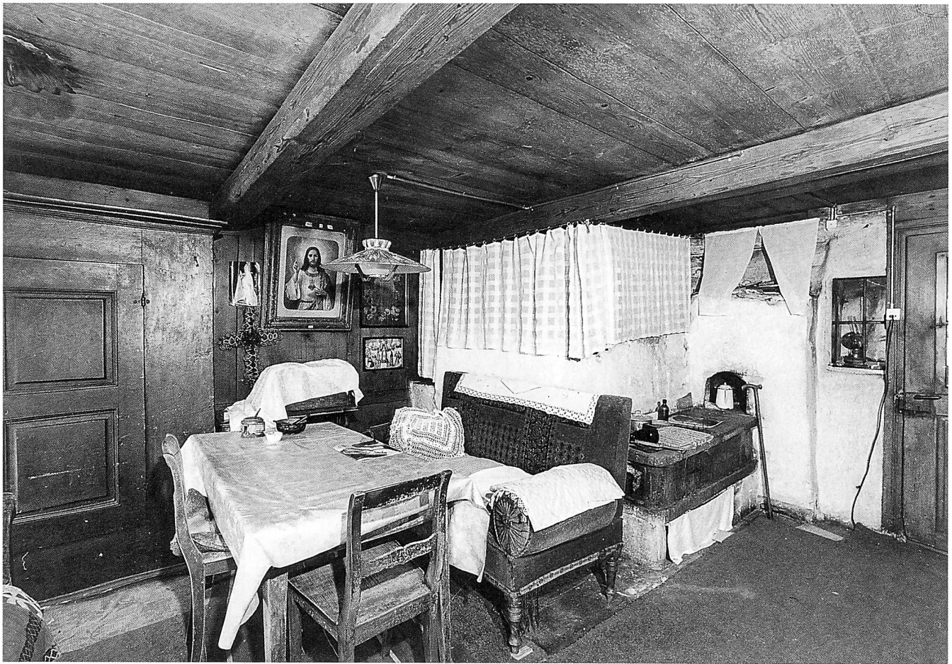
Alles scheint so, als ob die letzte Bewohnerin, Ida Rosa Freddi, nur kurz das Haus verlassen hätte. Blick auf Undalen mit seinen Flarzhäusern – ein einmaliges Beispiel für ländlich-industrielles verdichtetes Bauen. Im Vordergrund der Reihenflarz mit dem «Freddi-Haus», der vielleicht auf das 16. Jahrhundert zurückgeht und heute ein «Wohnmuseum» der besonderen Art darstellt.