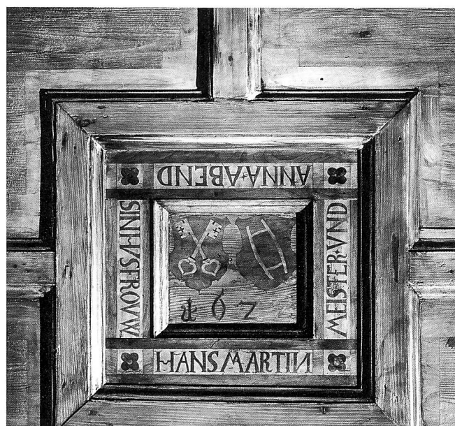
Das Wirtshaus «Sonne», Gesamtansicht von Süden und Deckenfeld mit der Inschrift von 1622.