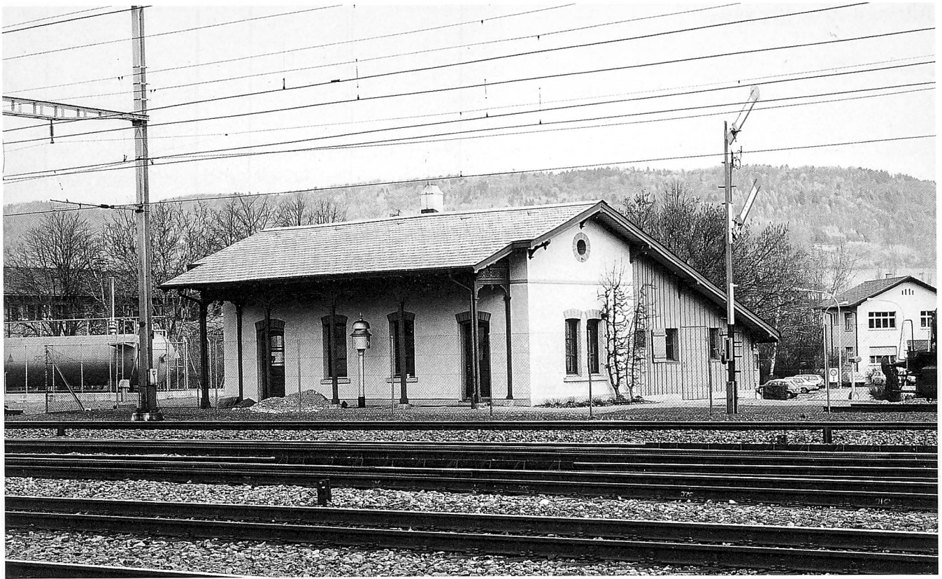
Das ehemalige Stationsgebäude der Spanischbrötlibahn von 1847 ist das älteste erhaltene der Schweiz. (Aus: Zum Abschluss der Renovation Bahnhof Baden – Renovation ehemaliges Stationsgebäude Dietikon – Restauration Hauptbahnhof Zürich, Dietikon 1980, und Kantonale Denkmalpflege Zürich)