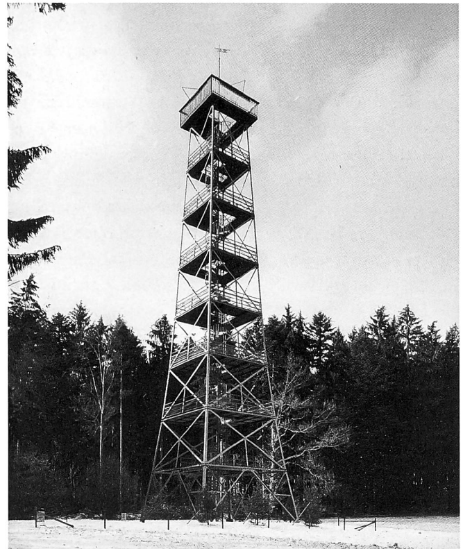
Ansichtskarte vom Bachtel mit dem Turm und dem 1893 nach einem Brand wieder aufgebauten Gasthaus, circa 1905, und der ehemalige Bachtelturm an seinem neuen Standort auf dem Pfannenstiel.