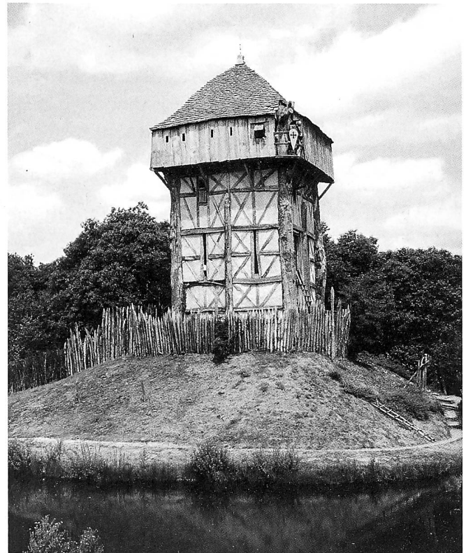
Luftaufnahme der Burgstelle Rüti und Rekonstruktion einer Holzburg in «Le Puy du Fou», Frankreich. Auf dem Hügel steht innerhalb einer Palisade ein mehrgeschossiger Hauptturm.