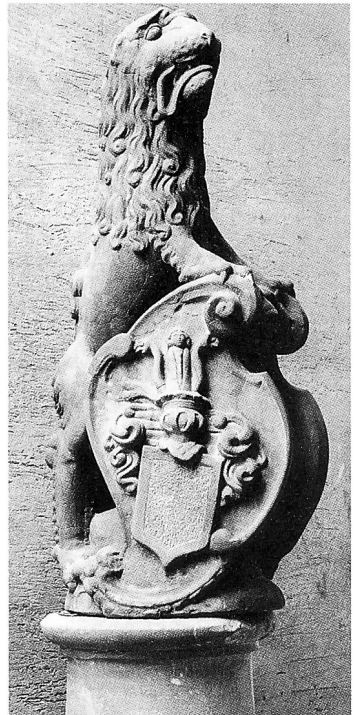
Das Schloss Flaach, ein mehrteiliger Gerichtsherrensitz, der aus einem Fachwerkhaus herauswuchs und im 17. Jahrhundert seine bis heute erhaltene Form fand. Auf dem Hofbrunnen wacht als Wappenhalter seit 1661 ein Löwe.