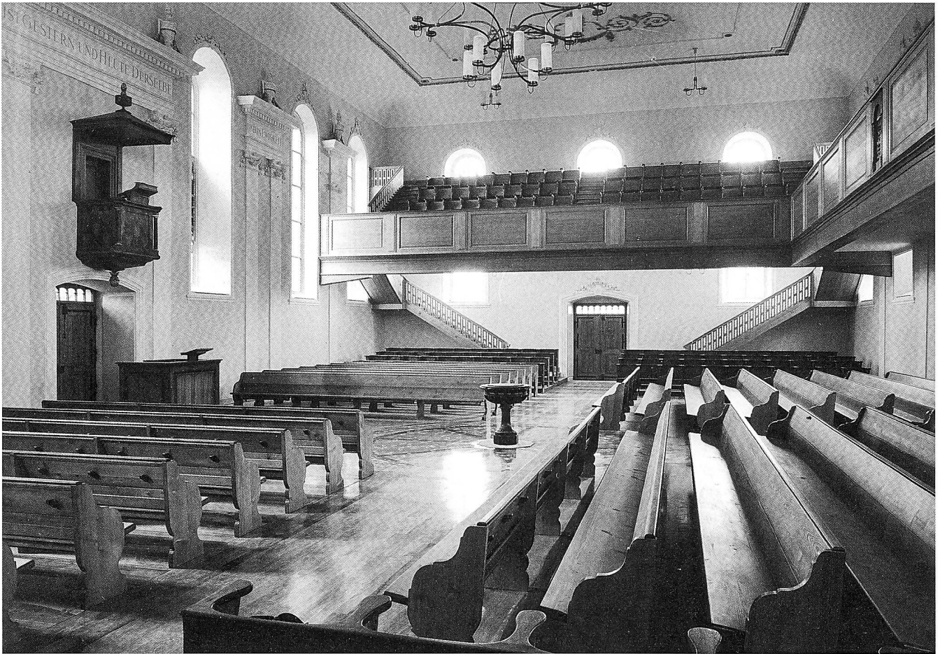
Unfall in der Kirche zu Gossau, den 22. Brachmonat 1820.

Die Kirche Gossau zählt zu jenen auf die zentrale Kanzel ausgerichteten Predigthallen, die für die zürcherische Landschaft in den Jahrzehnten vor und nach 1800 charakteristisch sind. Das schmutzige Innere lässt vergessen, dass der Bau der Kirche mit einer Katastrophe verbunden war, die als «Kirchenfall» in die Geschichte einging. Am 22. Juni 1820 stürzte beim Aufrichtefest der Dachstuhl zusammen und begrub viele Menschen unter seinen Trümmern. (Zeitgenössischer Holzschnitt aus: Heer: Die Kirche von Gossau)