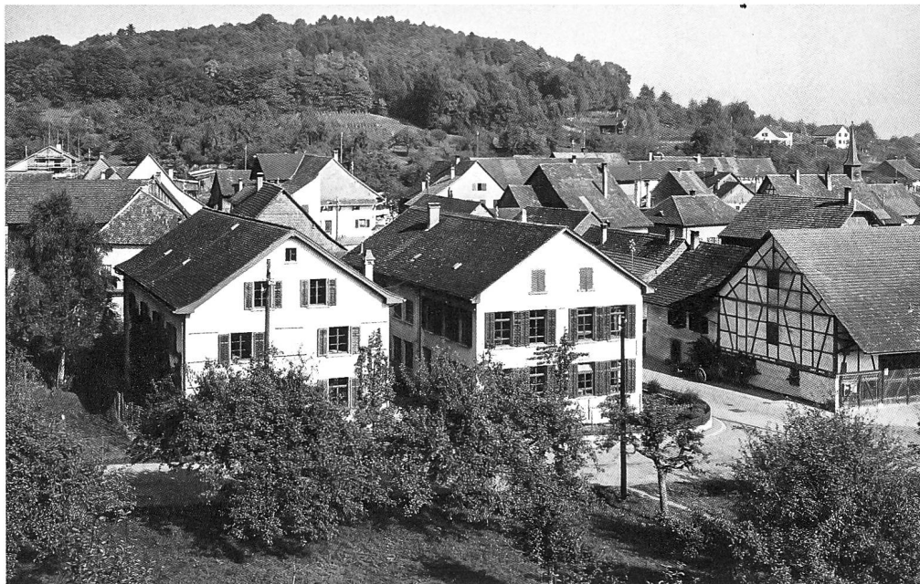
Die Arbeiterinnen an den Hutnähmaschinen der Firma Ritz in der Zwischenkriegszeit. Der relativ unscheinbare Doppelbau der Hutfabrik Ritz in Hüntwangen. Nachdem die Hutproduktion im Bauernhaus von Heinrich Ritz keinen Platz mehr fand, liess dieser 1890 ein eigentliches Fabrikgebäude bauen (auf dem Bild der hintere Teil des rechten Gebäudes). 1911 kam ein grosses Lager- und Speditionsgebäude dazu (links), und 1920 wurde das Fabrikgebäude vergrössert (vorderer Teil des rechten Gebäudes).