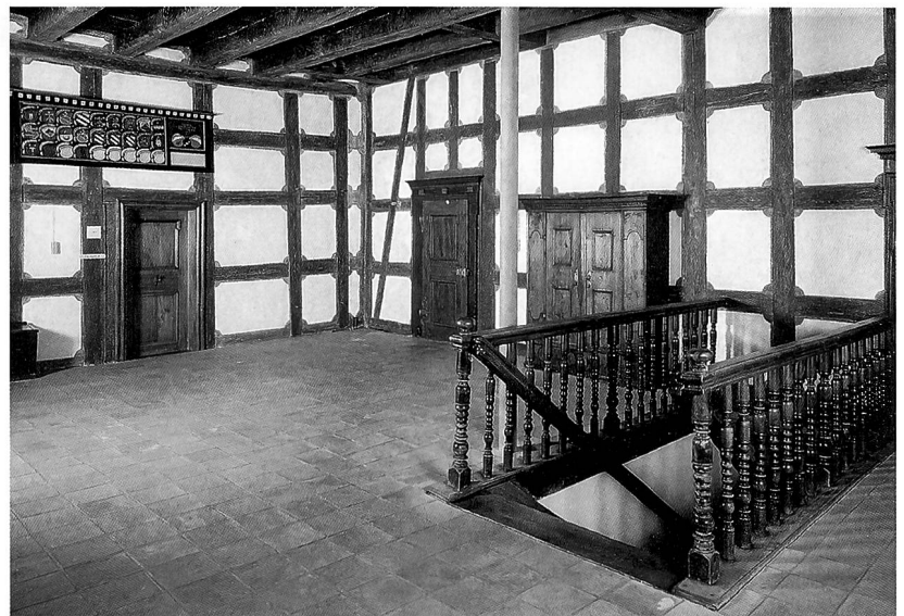
Das Amtshaus des Klosters Kappel, Aussenansicht, und Blick in die Halle im ersten Obergeschoss mit der Wappentafel der Amtsleute.