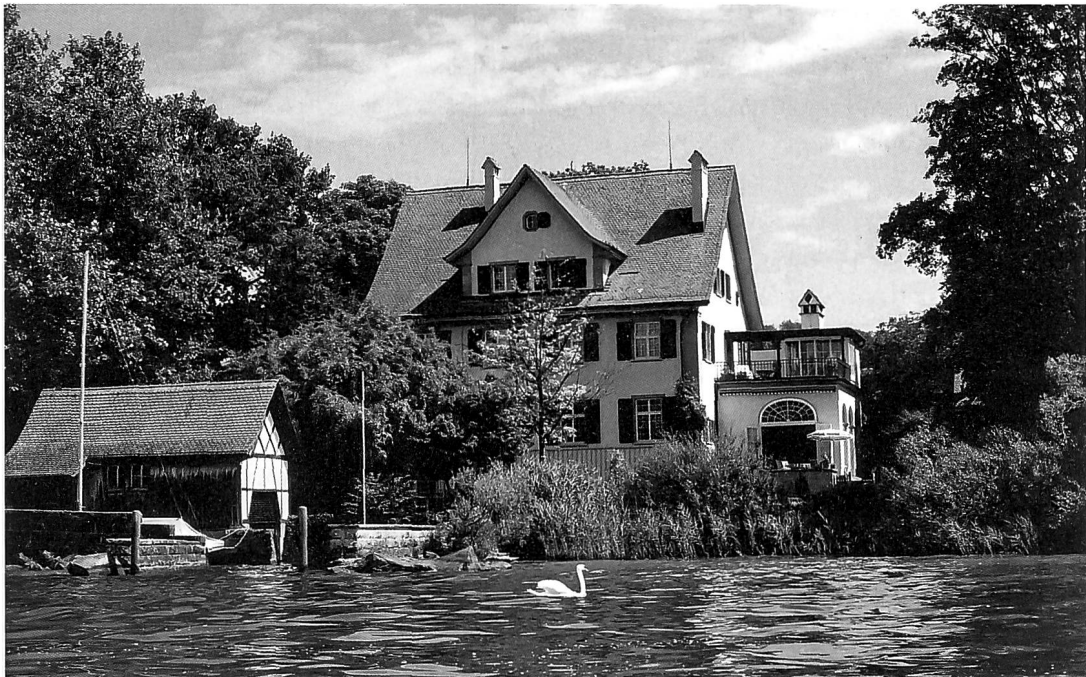
Wohnhaus von Carl Gustav Jung. Eingangsseite mit dem markanten Treppenturm kurz nach der Bauvollendung und Ansicht vom See her, Aufnahme von 2006.