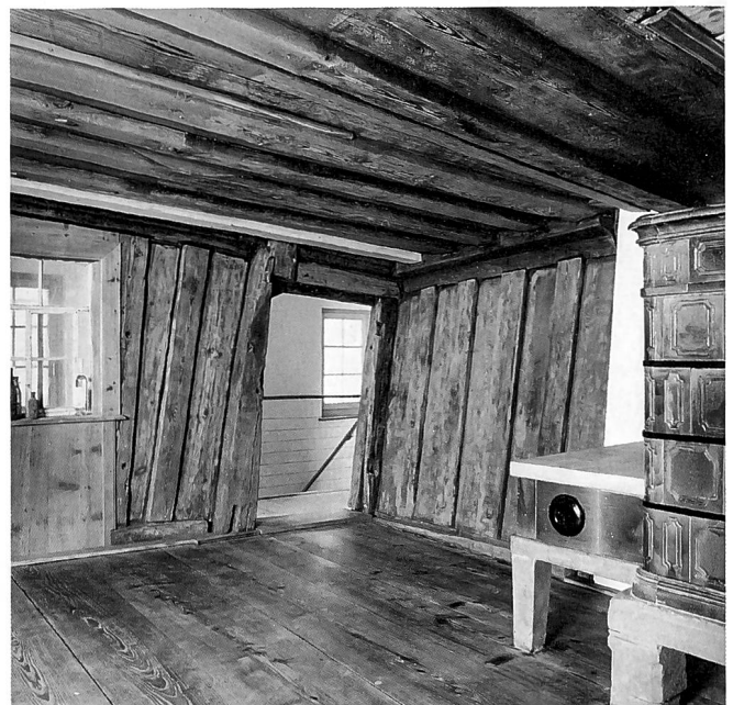
Das etwas versteckt liegende Gesellenhaus von Uhwiesen mit allen bei der Restaurierung beteiligten Personen bei der Einweihung 1997 und Blick in die heute ziemlich schief stehende Stube, ein spätgotisches Juwel.