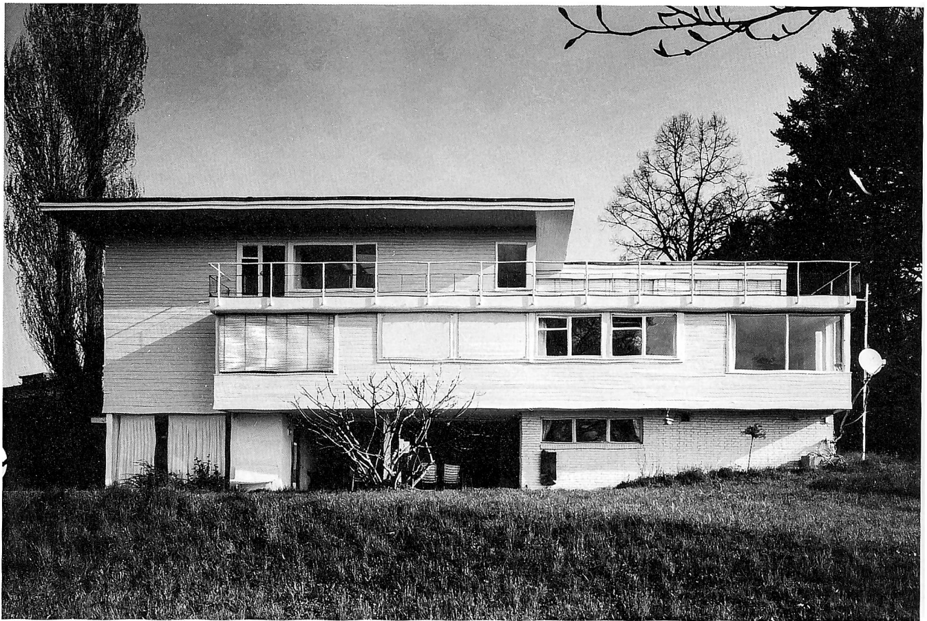
Aussenansicht Haus «Schlehstud»: Aufnahme 1999. (Foto Kantonale Denkmalpflege Zürich) Einige der Plastiken, die Hans Fischli in seinem Atelier angefertigt hatte, platzierte er auf der Terrasse und im eigenen Garten. (Aus: Moderne Schweizer Architektur, hg. von S. Giedion et al., Basel 1939/40, und aus: Bauhaus aus erster Hand, in: Ideales Heim, Januar 1988)