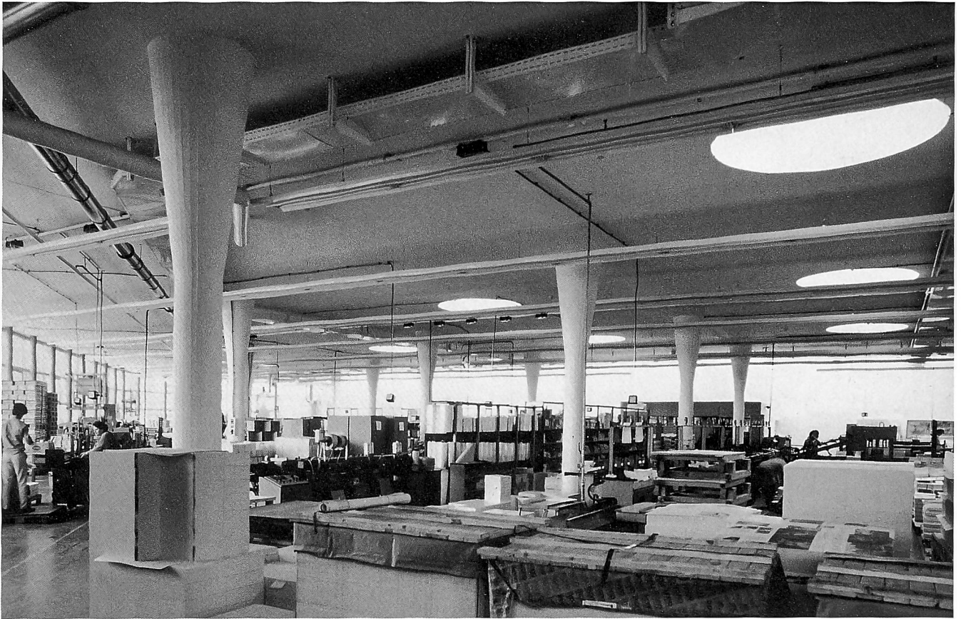
Der Bau der Buchbinderei Bubü, Aussenansicht und Blick in die Buchbinderei.