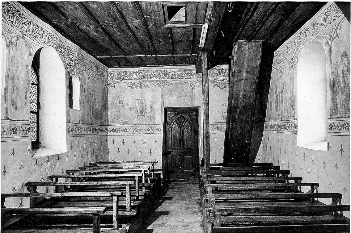
Oswaldkapelle Breite. Aussen- und Innenansicht. Aufnahmen 1996 beziehungsweise 1970.