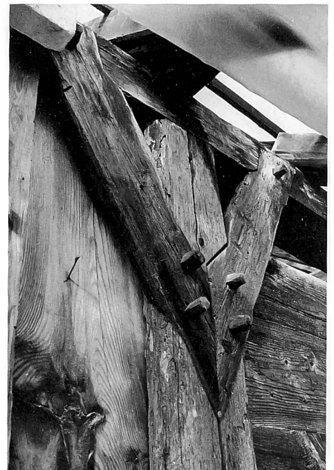
Bauernhaus «Bindern»: Ansicht von der Strasse her. Aufnahme 1992. Ein Ständer im Hausinnern mit angeblatteten Kopfhölzern. Aufnahme während der Restaurierung, 1988.