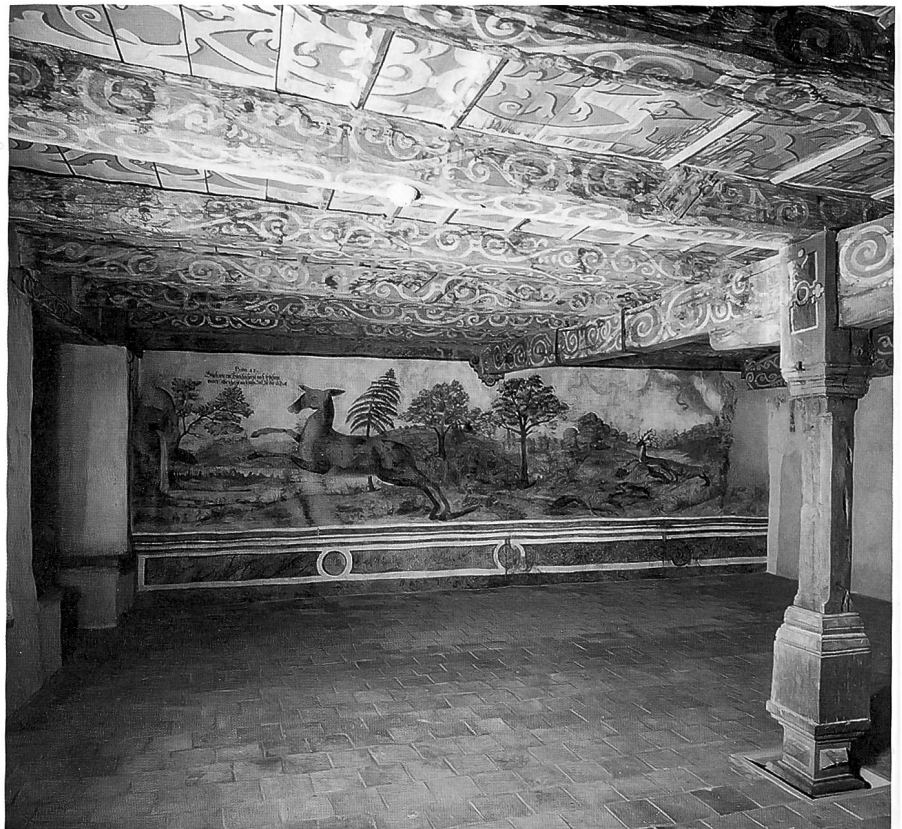
Engelfridhaus. Aussenansicht mit dem Stadtbrunnen im Vordergrund. Aufnahme 1947. Blick in den Saal im zweiten Obergeschoss mit bemalter Balkendecke und der Darstellung einer Hirschjagd. Aufnahme 2002.