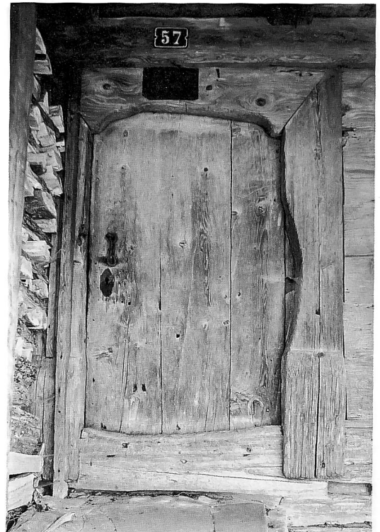
Ein äusserlich unscheinbarer Speicher, dient dieser Bau seit rund 450 Jahren bäuerlichen Zwecken und steht für die Zimmermannskunst der ländlichen Gesellschaft.