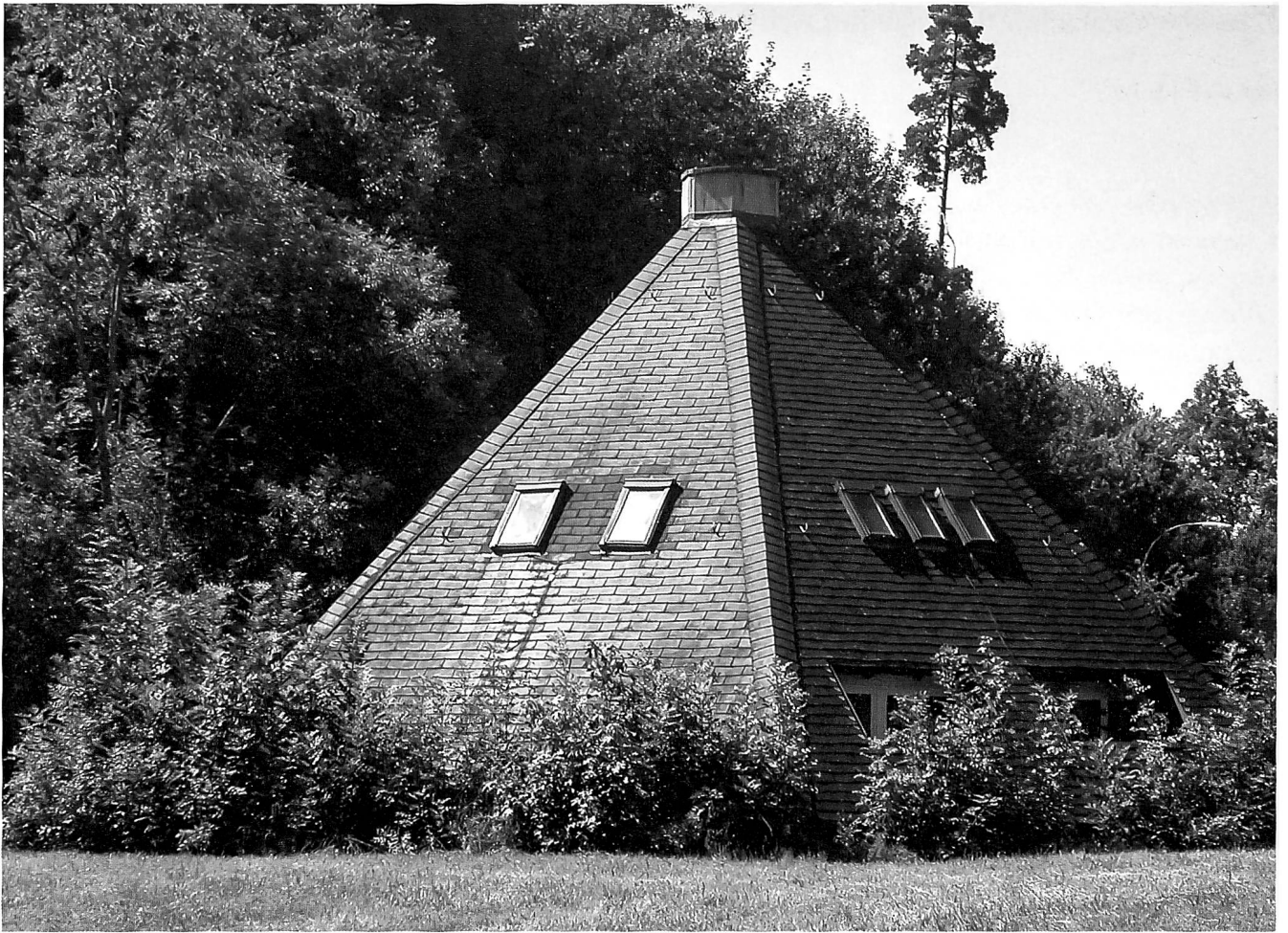
Das Pfadfinderheim 2006.