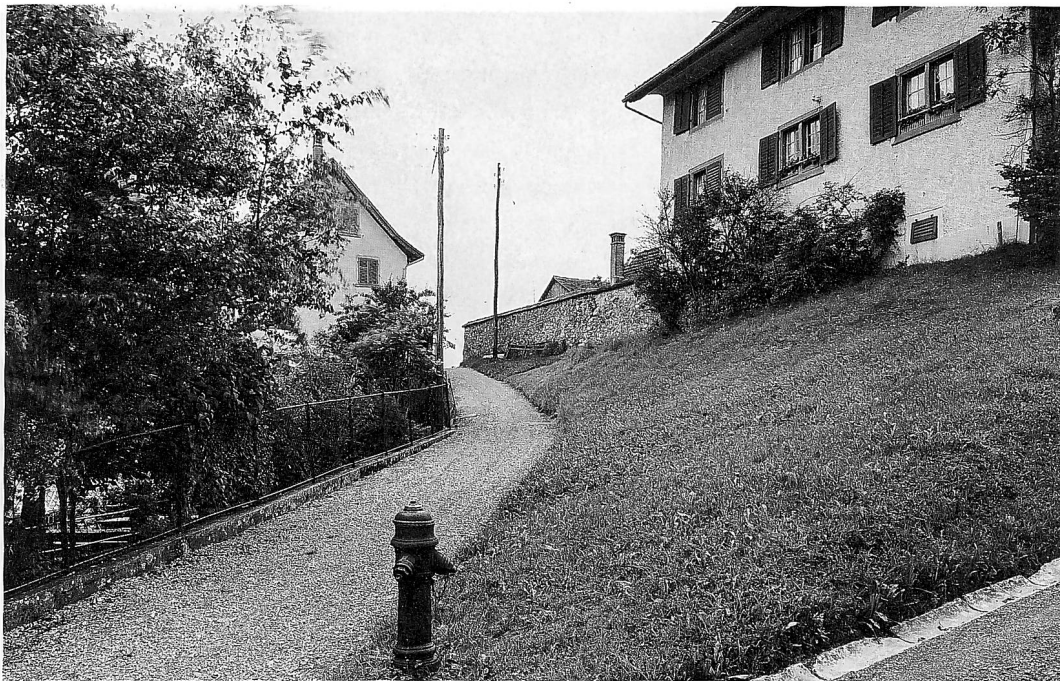
Der befestigte Kirchhof mit der Kirche (links) und dem Pfarrhaus (rechts). Zeichnung von Heinrich Meister (1700–1781).

Pfarrhaus und Friedhofmauer. Aufnahme 1959.