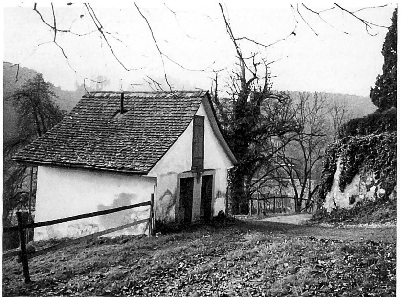
Das kommunale Gefängnis von Süden, mit der Kirche Stallikon, und von Nordosten.