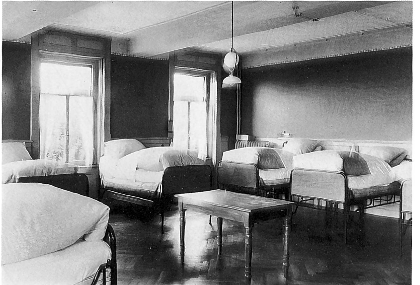
Pflegeheim Wäckerlingstiftung. Aussenansicht. Aufnahme 1972. Küche und Schlafsaal. Auf- nahme 1912.