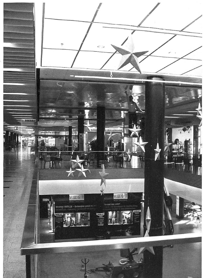
Das Volkiland entstand 1984 als vorläufig letztes grosses Einkaufszentrum im Kanton Zürich und weist eine charakteristische pavillonartige Architektur sowie, seit dem Umbau von 2001/02, einen hellen, grosszügigen Lichthof auf.