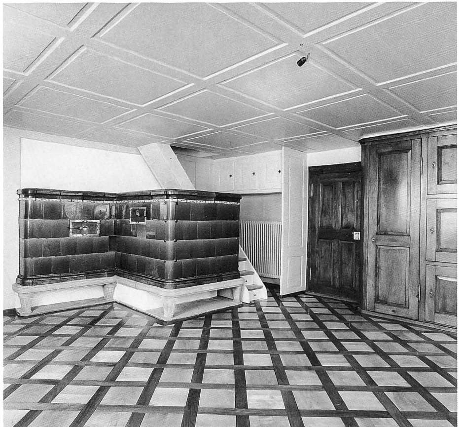
Das Neugut nach der Restaurierung. Aussenansicht und Blick in die Wohnstube. Aufnahmen 1993.