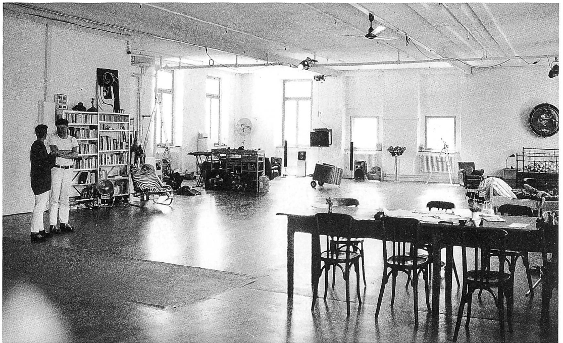
Blick auf das mehrteilige Ensemble der Fabrik in der Bleiche am Rand des Industriedorfes Wald, um die Jahrhundertwende. Die Gebäude dienen heute ganz unterschiedlichen Zwecken, so auch als grosszügige Lofts.