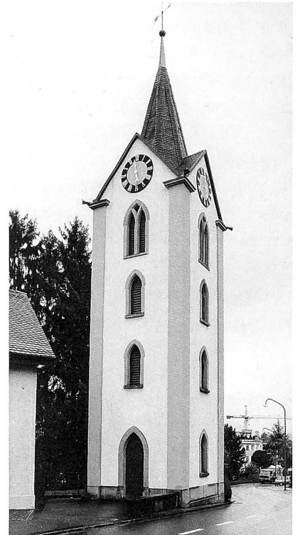
Der Kapellenturm in Rieden geht auf eine heute verschwundene Kapelle zurück und ist das Wahrzeichen der Dorfschaft Rieden. Er wurde im Zusammenhang mit einem Strassenprojekt 1866 neu errichtet.