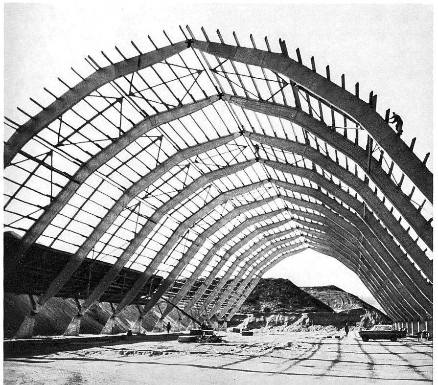
Brechsandhalle im Bau 1969 und nach dem Durchzug des Sturms «Lothar».