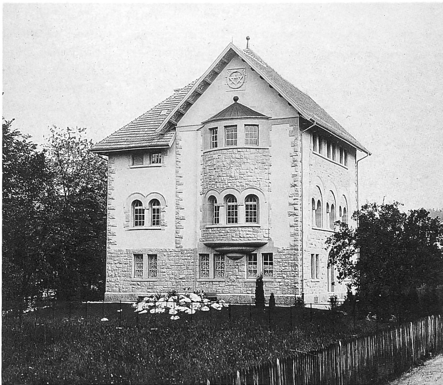
Ein in Stein gehauenes Lehrgebäude der Freimaurerei – der 1904 eingeweihte Tempel der Loge «Akazia» verbindet mittelalterliche Palast-Architektur und freimaurerische Symbolik. Diese setzt sich im Inneren fort und findet im eigentlichen Tempelraum ihren Höhepunkt, wo sich Teile der Ausstattung von 1820 erhalten haben und Grisaillemalereien an der Decke die freimaurerischen Tugenden verkörpern.