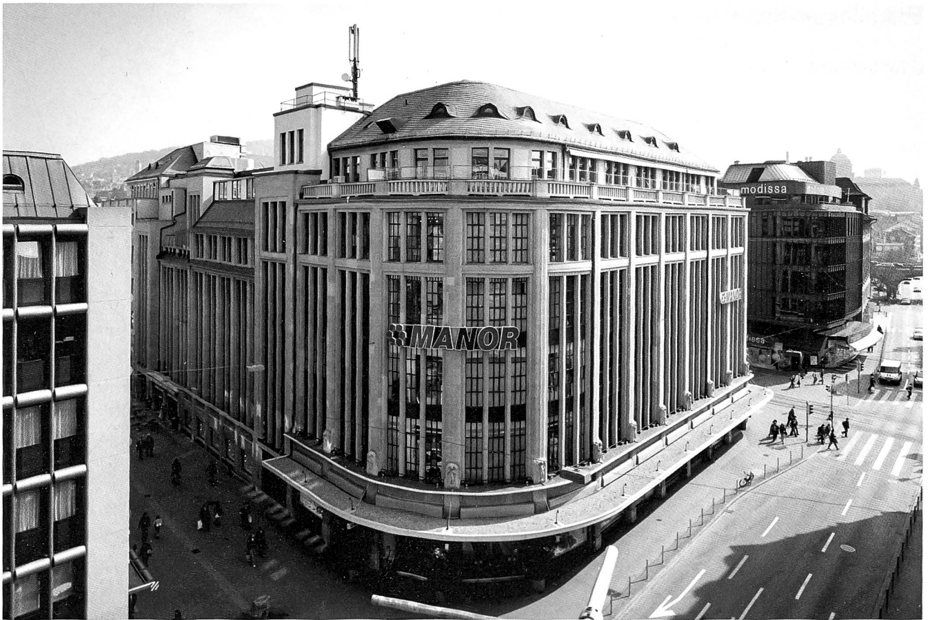
Aktuelle Ansicht des Manor an der Ecke Urania- / Usterstrasse von 2006. Die Aussenfassade der in Glas aufgelösten Wände von 1928 wurde bis auf einige Details beibehalten. Der Lichthof im Inneren des Warenhauses Brann mit Brüstungen und Pfeilern aus südfranzösischem Marmor, um 1930.