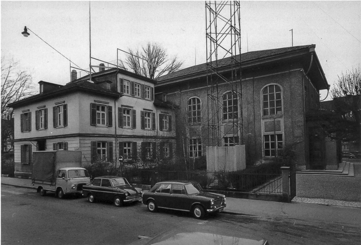
Die Lukas-Kapelle (1883–1966) in Zürich-Aussersihl. Links das Pfarrhaus.

Evangelisten Lukas als Patron, weshalb sich der Name «Lukas-Gemeinde» einbürgerte. 1908 wurde, wiederum mit Spendengeldern, eine Orgel eingebaut.