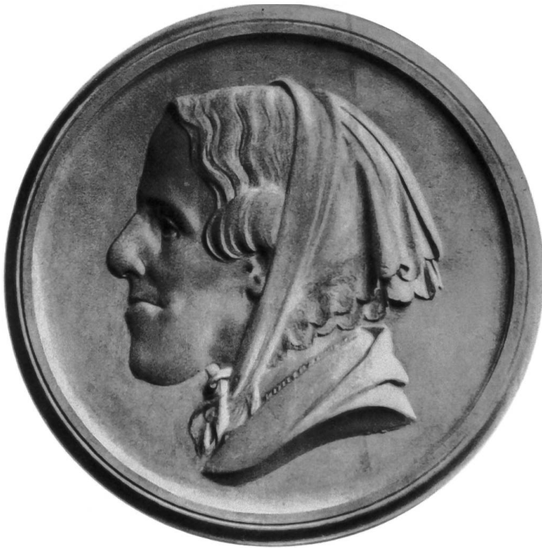
Vermutlich posthum angefertigtes Medaillon mit dem Porträt Mathilde Eschers

katholischen Gemeinde, dann bis 1895 der anglikanischen Gemeinde und schliesslich bis 1912 der lutherischen Gemeinde. Danach musste sie dem Bau des Geschäftshauses «Annahof» weichen. 4