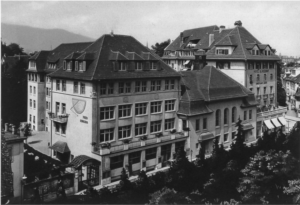
1909–1911 wurde der «Glockenhof»-Komplex errichtet. Links das Freie Gymnasium, in der Mitte die neue St.-Anna-Kapelle, rechts das Hotel und Vereinshaus «Glockenhof».