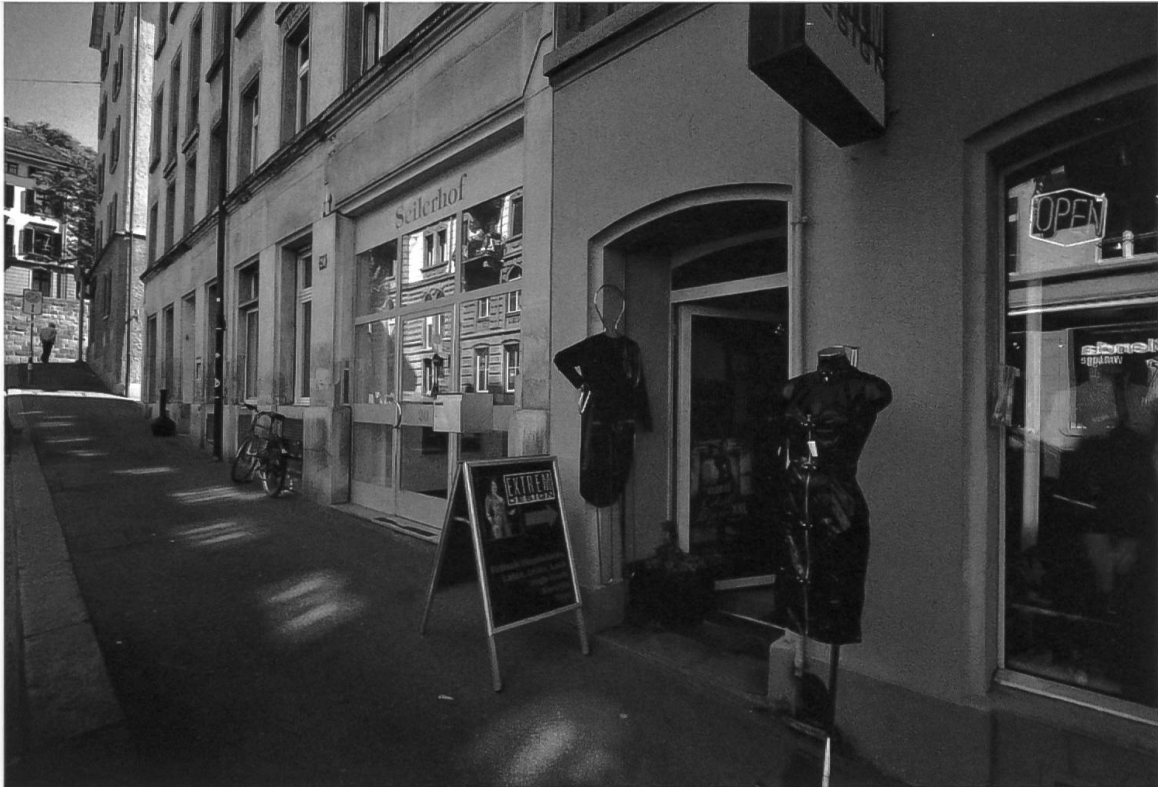
Der «Seilerhof», Sitz der Evangelischen Gesellschaft und des «Cafés Yucca», befindet sich dort, wo die Zielgruppen der diakonischen Arbeit leben. Die Heringstrasse 20 am 3. September 2010.

tung aufgebaut worden ist: 21 «Die traditionellen Klienten der Passantenhilfe sind jene Leute, die ihr Leben so organisieren, dass sie von Pfarrhaustür zu Pfarrhaustür ziehen und jeweils um ein kleines Handgeld bitten. Zunehmend kommen sogenannte «Wanderarbeiter» aus den neuen EU-Ländern in die Schweiz mit einer Vision, die sich nicht in die Realität umsetzen lässt, in der Hoffnung auf Arbeit. Für sie treffen wir Abklärungen mit den Behörden, ihnen müssen wir aber auch häufig klarmachen, dass sie hier keine Chancen auf eine Arbeitsbewilligung haben, da sie weder über einen Aufenthaltsort noch einen Arbeitsvertrag verfügen.»