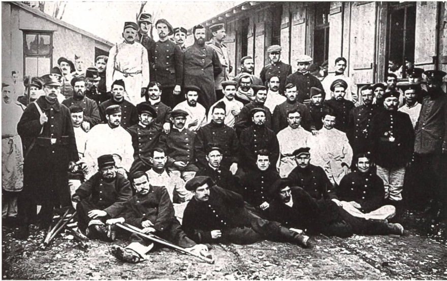
Gefangenenaustausch mit Schweizer Unterstützung: französische Schwerverwundete im Barackenlager Konstanz vor ihrer Abreise nach Westen (oben) und deutsche Schwerverwundete nach ihrer Durchreise durch die Schweiz.