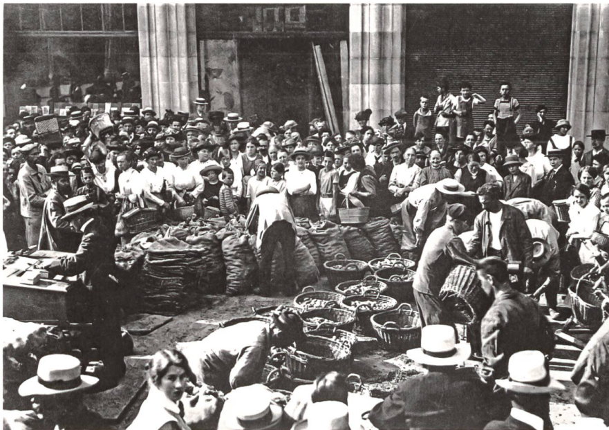
Staatliche Lebensmittelfürsorge: Ausgabe von verbilligten Kartoffeln an der Uraniastrasse, 1917.

das Tramgeleise warfen, um die Weiterfahrt des Trams zu verhindern. Kurz und gut, ich habe meine Pflicht getan und darum musste ich ins Loch.» 37 Im Unterstützungsgesuch für Karl Laibacher vom 27. September 1919, der wegen antimilitaristischer Propaganda zu zwei Monaten Gefängnis verurteilt wurde, heisst es: «K. Laibacher befindet sich in der Polizeikaserne. Bekanntlich ist dort die Verpflegung miserabel und auch die übrigen Verhältnisse stellen an die Nervenkraft eines Gefangenen grosse Anforderungen. Deshalb scheint es doppelt nötig, dass Laibacher wenigstens genügend Nahrung hat, damit er seine Haft nicht als seelisch gebrochener Mensch verlässt.» 38