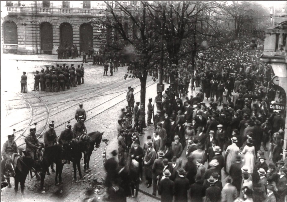
Kavallerie am Paradeplatz am Samstag, 9. November 1918. (Stadtarchiv Zürich, V.L. 82)