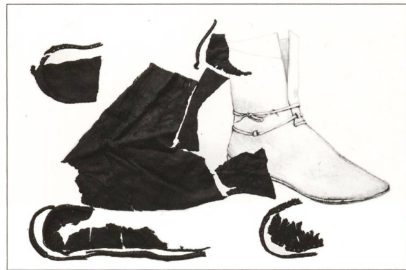
Aus einer Latrine an der Dorfstrasse stammen Lederfragmente von vier Schuhen des 12./13. Jahrhunderts. Ein bis zur Wade reichender Schuh der Grösse 43–44 ist fast vollständig erhalten. (Zeichnung: Marquita Volken, Gentle Craft, Lausanne)

Schuhe des 12./13. Jahrhunderts enthielt. 6 Die Machart der Schuhe weist auf wohlhabende Besitzer hin, die zum Umfeld der Kyburg passen.