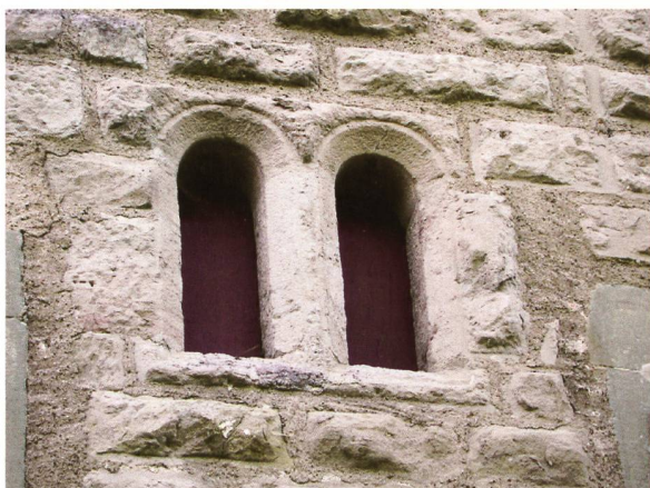
«Grafenhaus», Ostfassade: Von den drei Doppelrundbogenfenstern aus kyburgischer Zeit ist eines noch in unverändertem Zustand erhalten.