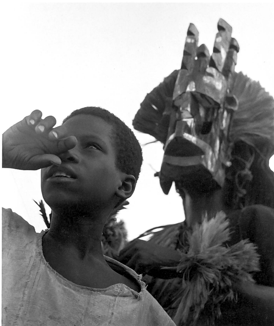
Abb. 2: Das Bild eines «Dogonjünglings» entstand im Frühjahr 1960 in Mali. Parin schrieb dazu: «Er blickt hoffnungsvoll in die bessere Zukunft [...]. Doch hinter ihm erhebt sich drohend oder geheimnisvoll die Tanzmaske, mit der die Dogon die Lebenskraft ihrer verstorbenen Vorfahren verteilen.» Zitiert nach Paul Parin: Zu viele Teufel im Land. Aufzeichnungen eines Afrikareisenden, Klagenfurt 2008, S. 11.

satz von individueller Psyche und allgemeiner Gesellschaft suchte man aufzuheben, indem man sich besonders für frühkindliche Sozialisierung interessierte. 9