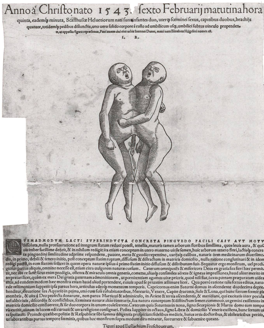
Abb. 4: Flugblatt von der Schaffhauser Missgeburt. Das älteste der drei von Jakob Ruf überlieferten Flugblätter thematisiert eine Wundergeburt, ein siamesisches Zwillingpaar, das 1543 in Schaffhausen geboren wurde. Von den zwei Mädchen war eines bereits vor der Geburt tot, das andere starb wenige Stunden nach der Geburt. (Zentralbibliothek Zürich, Graphische Sammlung und Fotoarchiv, PAS II, 15/27)

richtigen Ort war, konnte die städtischen Strukturen im Medizinalwesen als Sprungbrett nutzen. Das gelang Ruf in bemerkenswerter Weise.