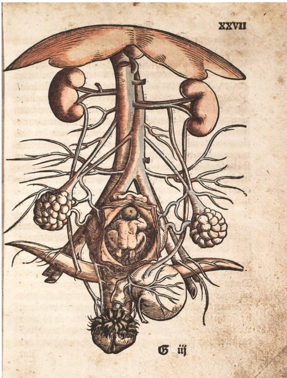
Abb. 6: Der Autor popularisiert das anatomische Wissen der Zeit und setzt Bilder als Lernmedien ein, damit seine Leserinnen sich die im Körperinnern verborgenen Organe vorstellen können; mehrere Situsbilder führen sukzessive ins Innere der Gebärmutter, wo der Fötus heranwächst.