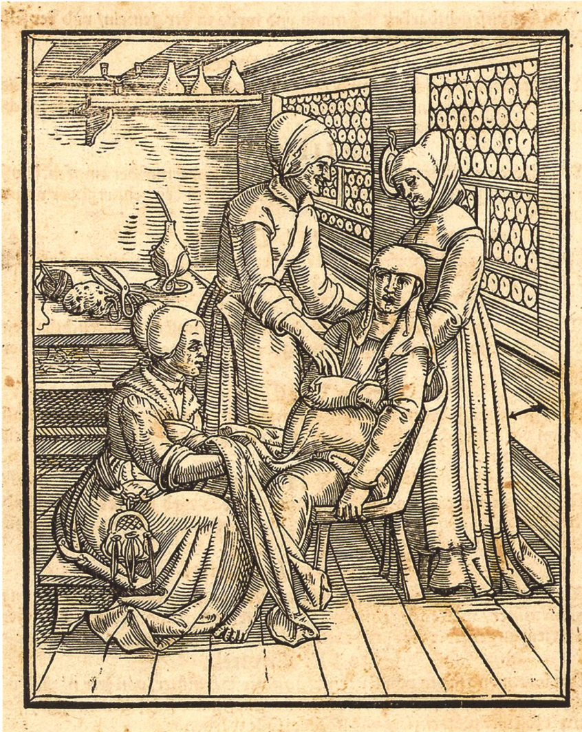
Abb. 2: Geburtsszene in einer Stube. Die Geburtshilfe war die erste Berufssphäre für Frauen. In Zürich gab es Hebammen, die instruiert, geprüft und offiziell besoldet waren. Die Geburtshelferinnen übten ihren Beruf in Schlafzimmern und Wohnstuben aus. Die Hochschwangere sitzt im Gebärstuhl, die Hebamme zu ihren Füßen auf einem Schemel, zwei Helferinnen stehen an ihrer Seite. Schere und Faden zum Abbinden der Nabelschnur liegen auf dem Tisch bereit. Dass dort keine geburtshilflichen Instrumente liegen, ist ein gutes Omen. (Kantonsbibliothek St. Gallen, Vadianische Sammlung, VL 1521, Bl. bb4v)