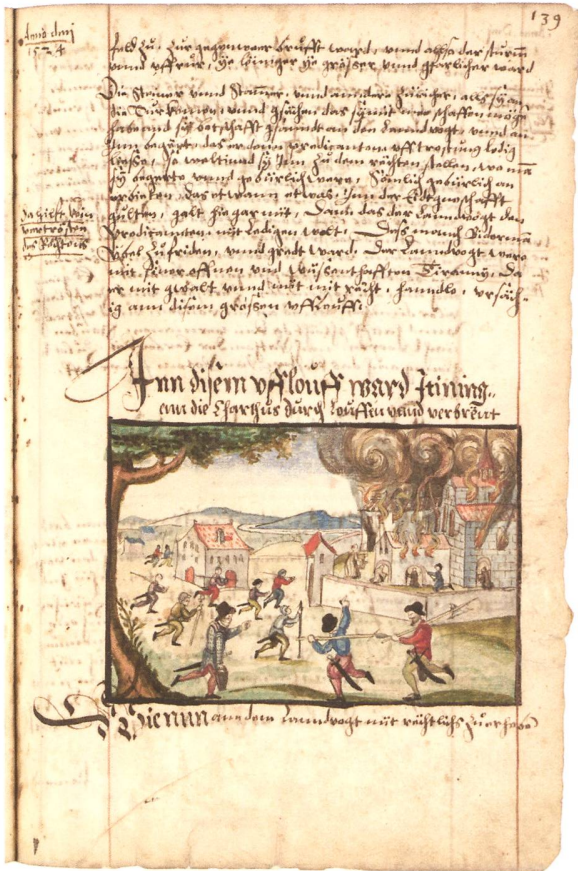
Kolorierte Federzeichnungen in der Abschrift von Bullingers Reformationschronik, erstellt 1605/06 von Heinrich Thomann. (Zentralbibliothek Zürich, Handschriften, Ms. B 316, f. 139r, f. 142v, f. 145r, f. 157v)