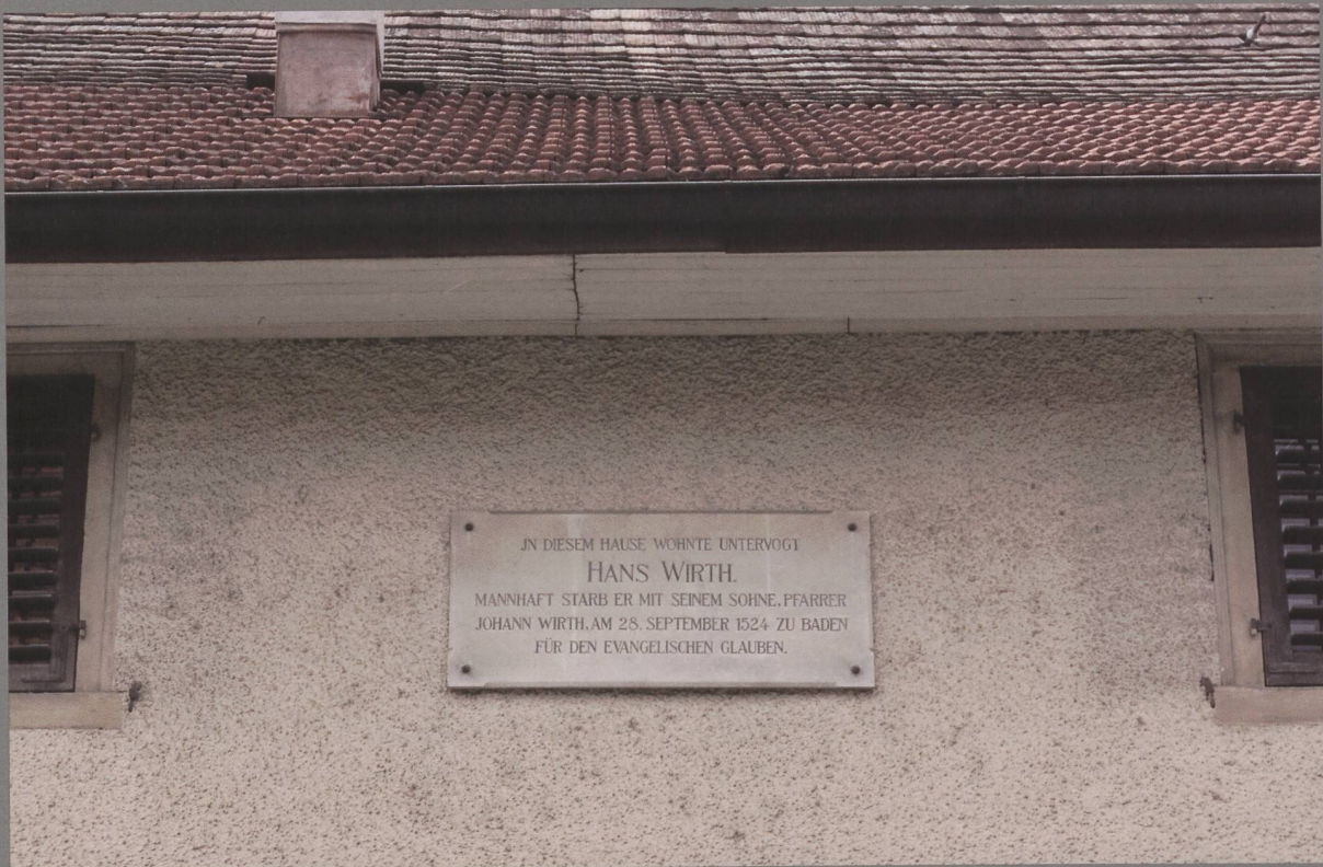
Abb. 1: Gedenktafel am «Wirthenhaus» in Oberstammheim.