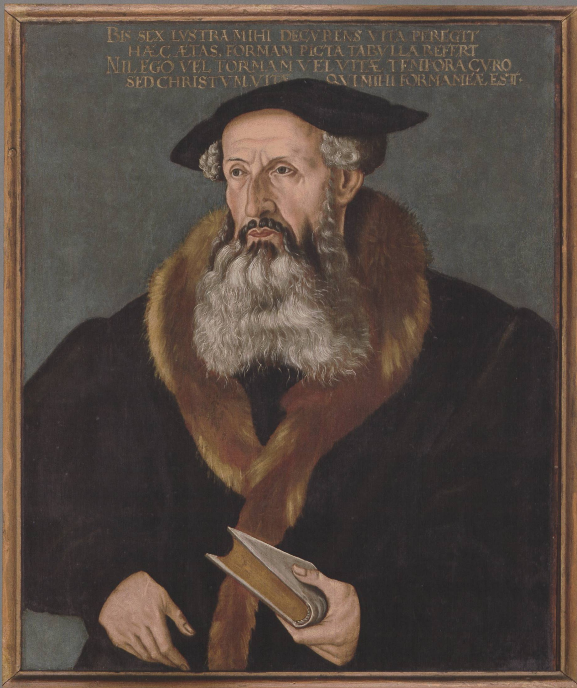
Abb. 1: Tobias Stimmer (1539–1584), Werkstatt, Porträt Heinrich Bullingers, wohl kurz nach 1564, Öl auf Holz. (Zentralbibliothek Zü- rich, Graphische Sammlung und Fotoarchiv, Inv 483)