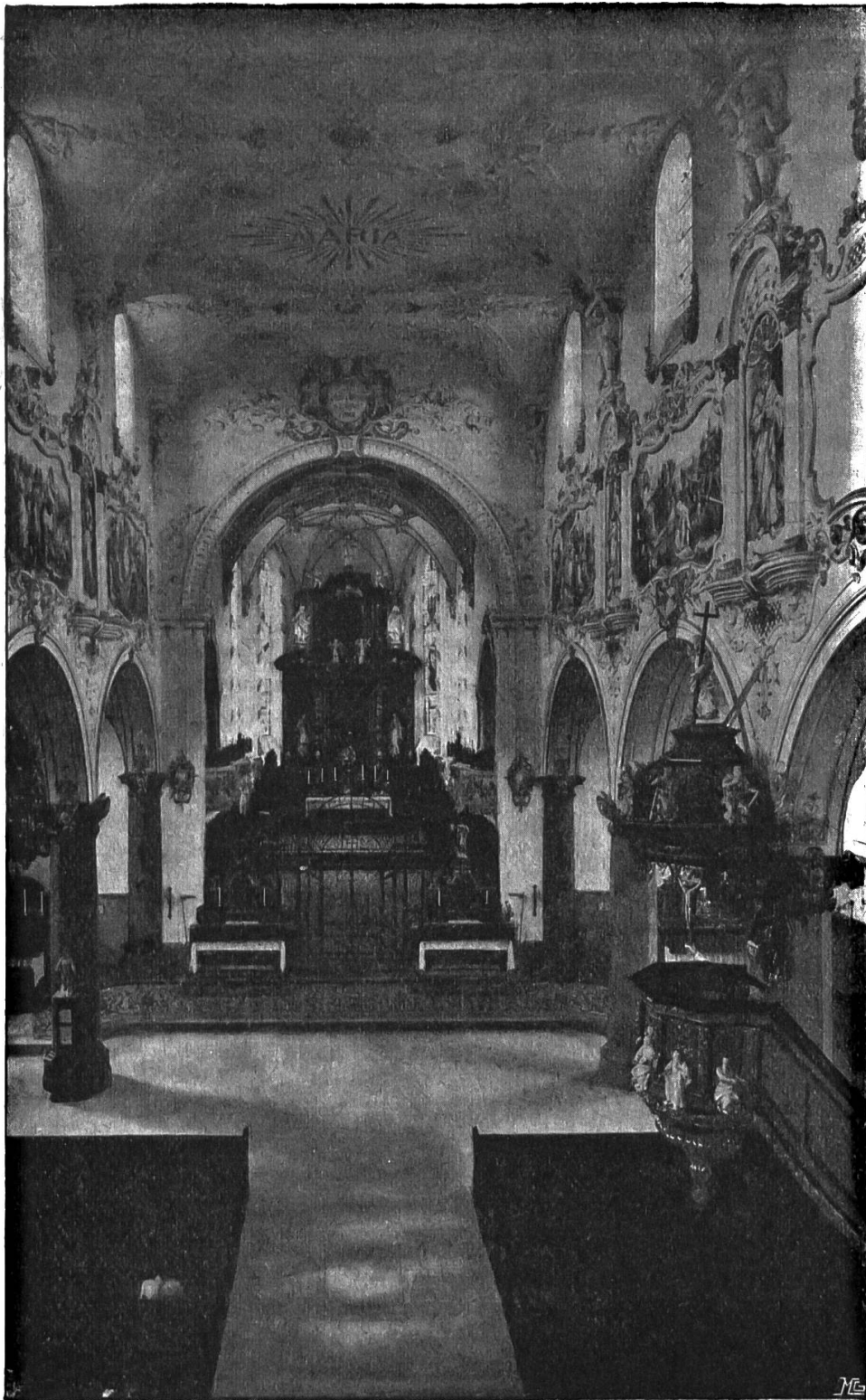
Inneres der Wallfahrts-Kirche von Maria Stein