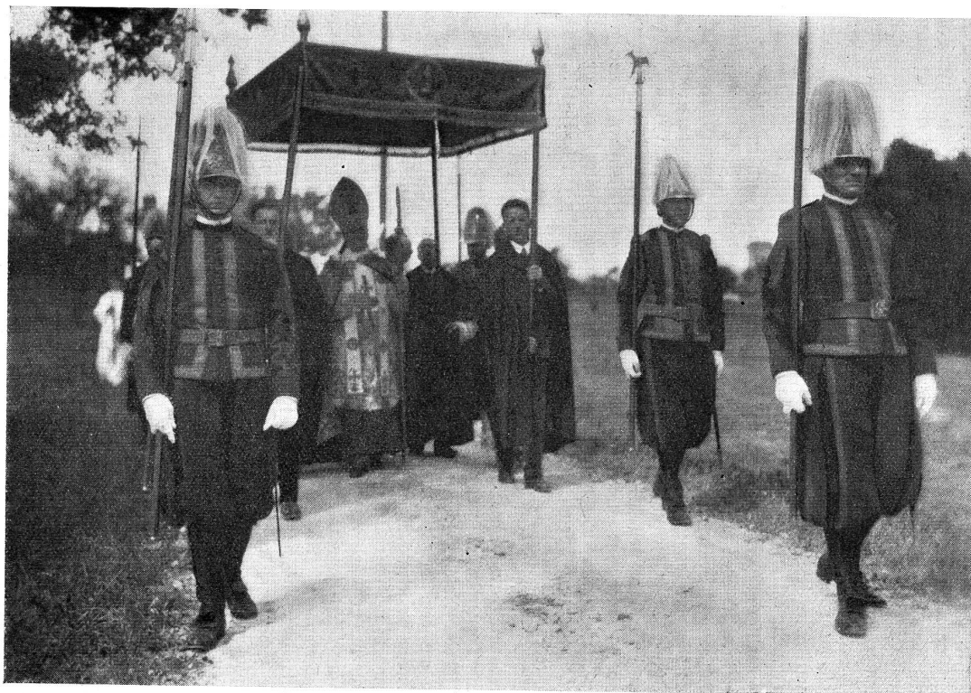
Nuntius Di Maria bei der Prozession in Martastein.