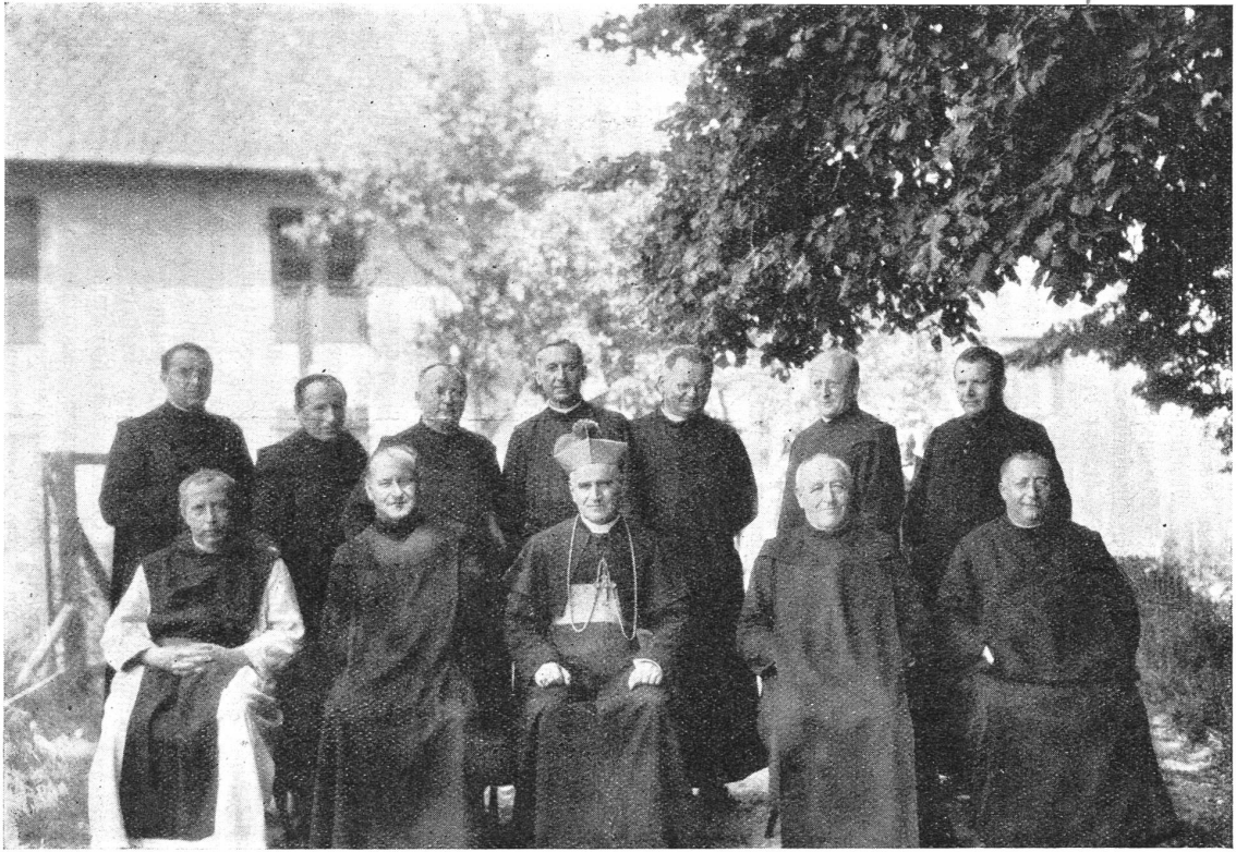
Der Nuntius mit Mariasteiner Patres und einigen Gästen