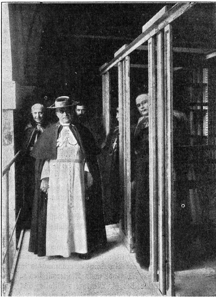
Pius XI. besichtigt die neuen Bücherräume der Vatikanischen Bibliothek

Die Kirche Christi freut sich und jubelt mit ihrem sichtbaren Oberhaupte, dem glorreich regierenden Papst Pius XI., über die glückliche Lösung der „Römischen Frage“. Wahrlich ein schönes und großes, ja welthistorisches Festgeschenk zum goldenen Priesterjubiläum, welches der hl. Vater dieses Jahr mit seinen Kindern feiert, ist die Wiedererrichtung des 1870 unterdrückten Kirchenstaates. Wenn auch derselbe heute viel kleiner wie ehemals und nur mehr die sog. „Vatikanstadt“ umfaßt, so genießt doch der Papst wieder als Souverän die volle Freiheit und Unabhängigkeit von jeder irdischen Macht.