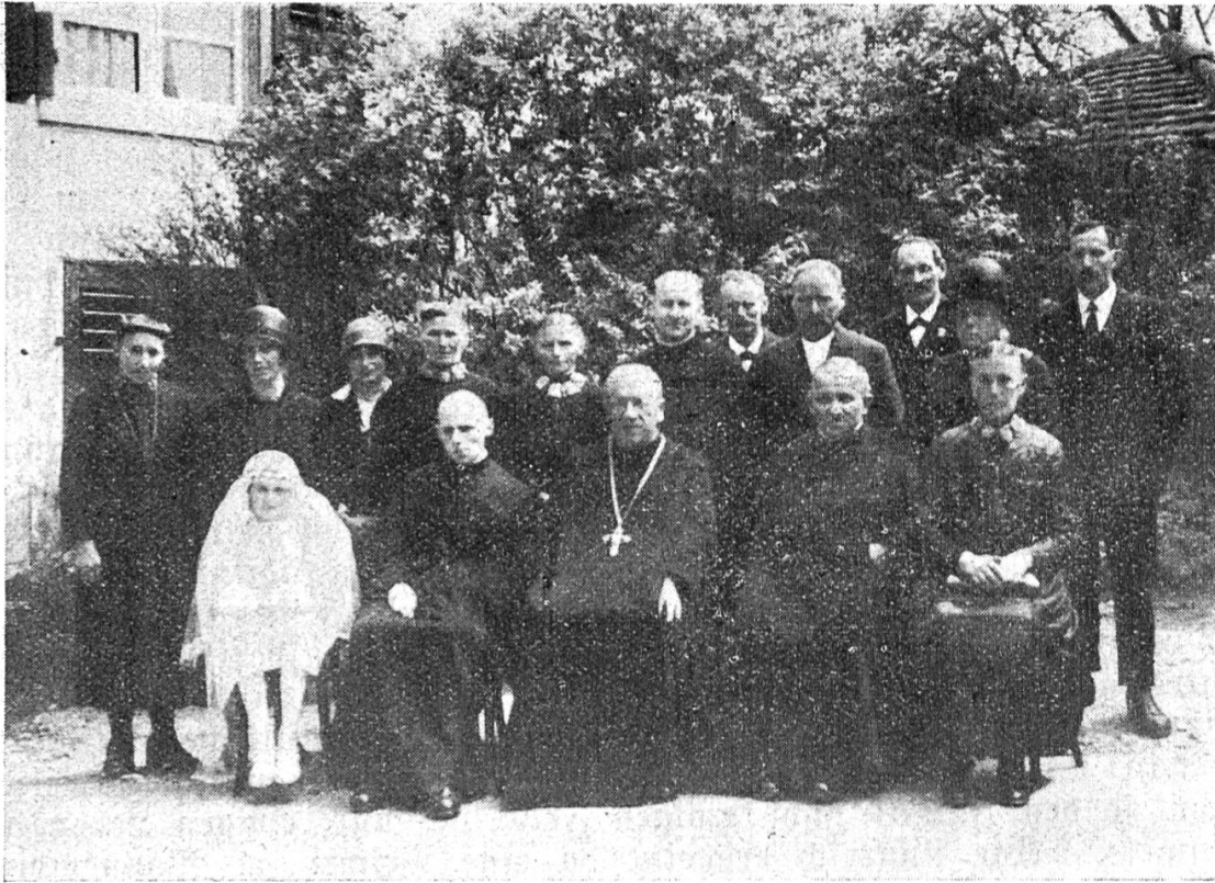
Die Gäste bei der Primiz in Mariastein