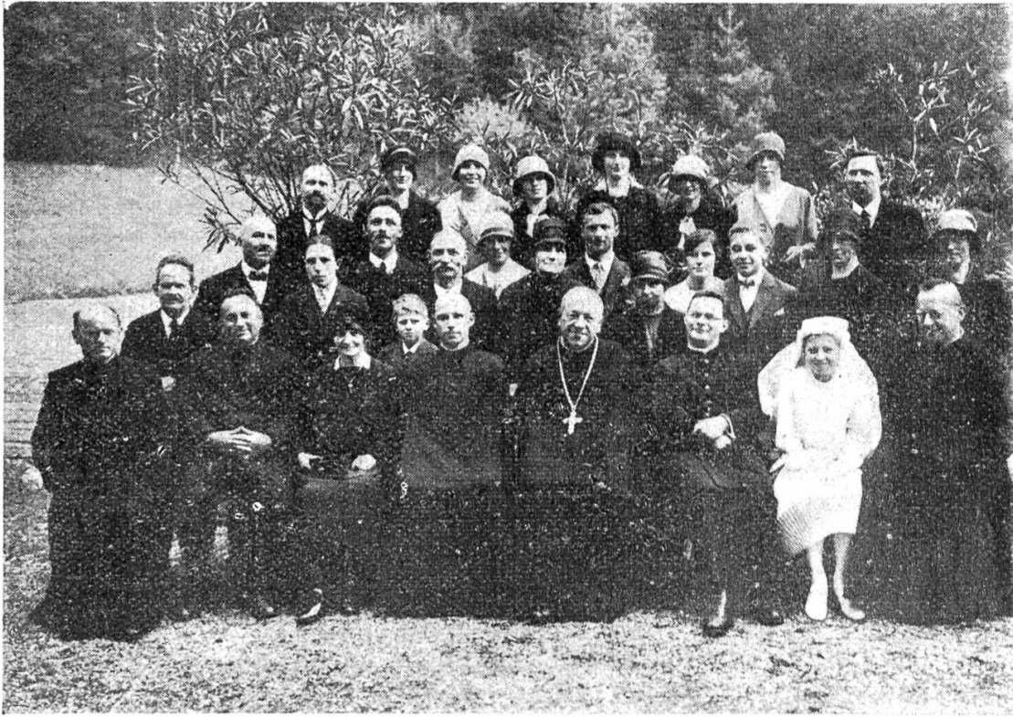
Die Gäste bei der Primiz im St. Gallusstift Bregenz