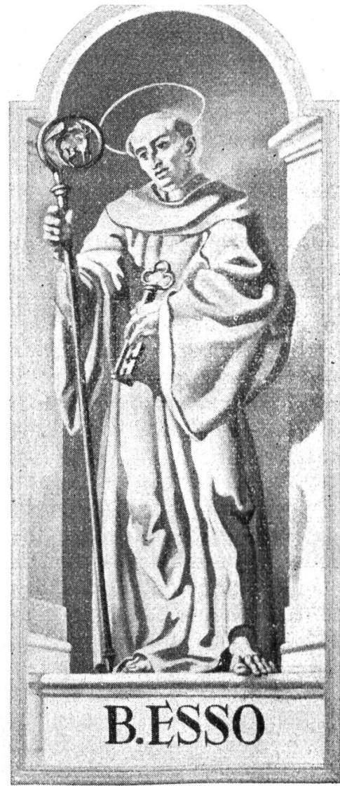
I. Abt von Beinwil-Mariastein