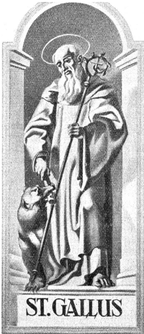
Abt und Gründer des Benediktinerklosters St. Gallen