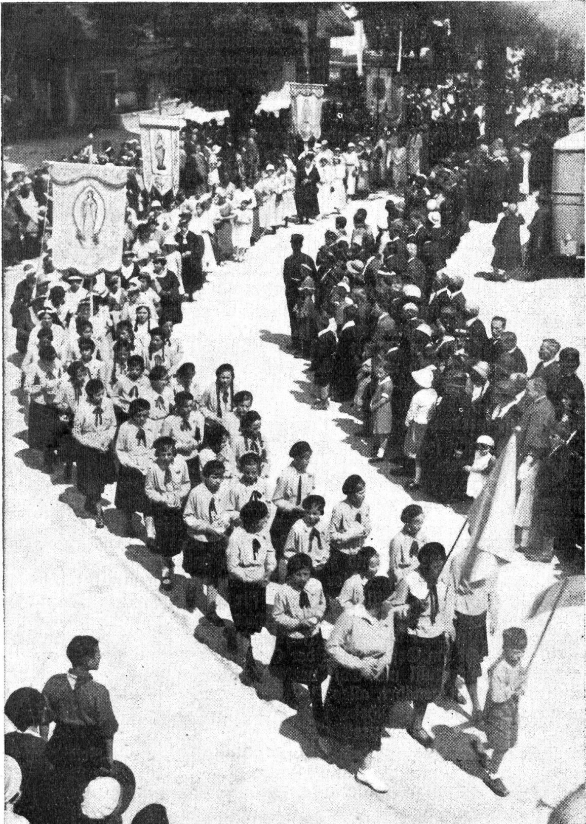
Imelda-Gruppe von Therwil bei der Prozession am Maria Trostfest 1933