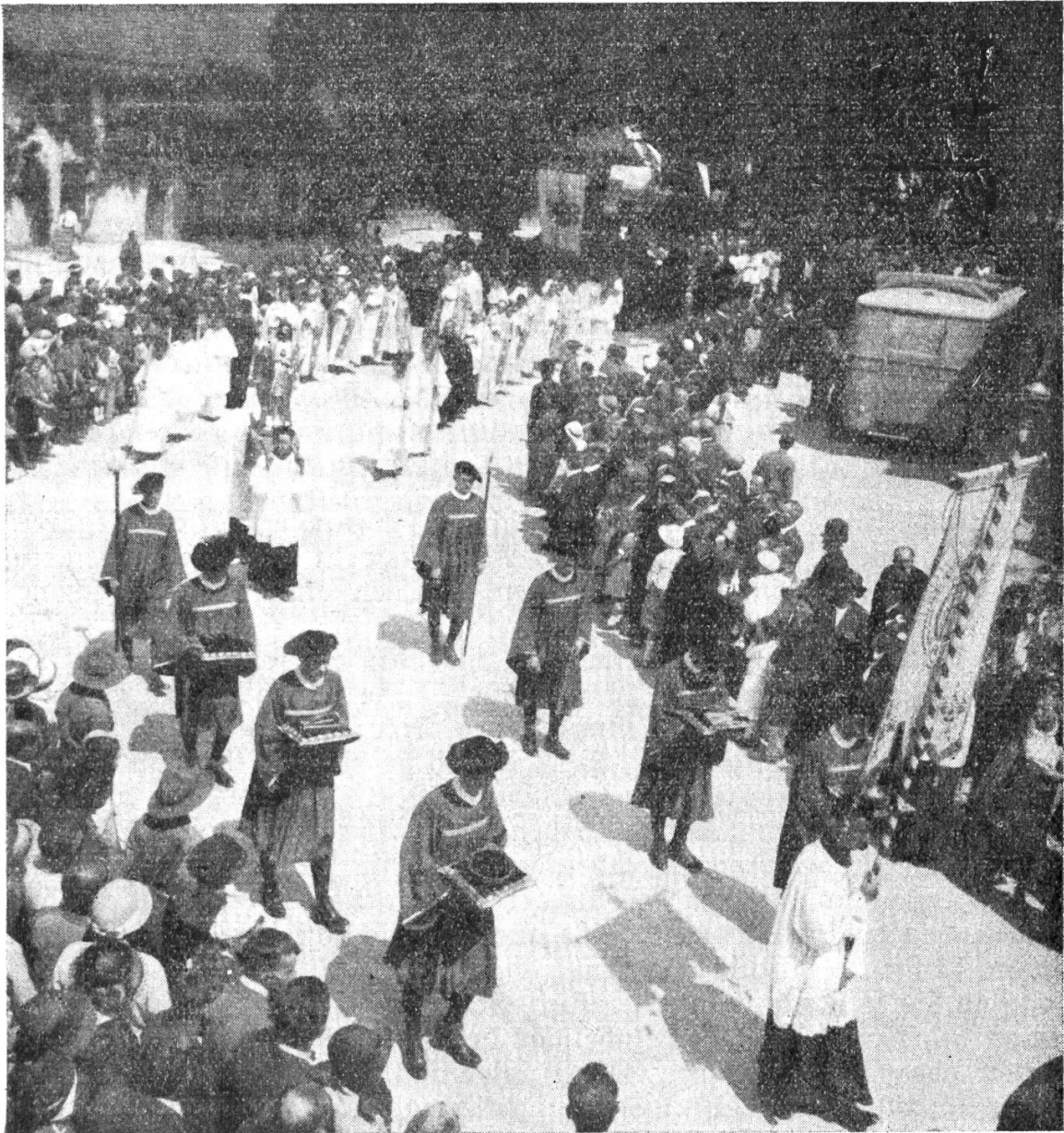
Gruppe mit den Leidenswerkzeugen bei der Maria-Trost-Prozession 1933

Feier; erhalten ist nur noch die Eisenspitze (in der Wiener Schatzkammer). Von den hl. Nägeln haben höchstens diejenigen in Rom Anspruch auf Echtheit. Das Fest von Lanze und Nägel wird meist am Freitag der 1. Fastenwoche gefeiert.