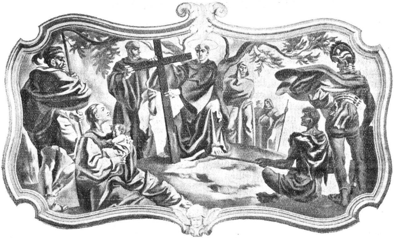
St. Benedikt predigt das Evangelium

her und besonders noch aus seiner Vaterstadt und Rom eilen ihm Jünger zu. Es kamen Landleute, Handwerker, Künstler, Geistliche, die sich vor den neuen arianischen Herren des Landes in die Einöde zurückzogen; es kamen Bürger und Patrizier; Freie und Unfreie, sie alle wollten unter St. Benedikts weiser Leitung dem ewig herrlichen Ziele entgegen eilen.