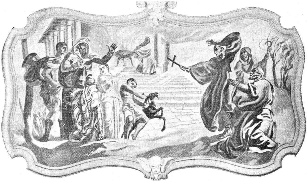
St. Benedikt zerstört den Götzentempel auf Monte Cassino

ihm alles Geld, das im Zimmer zu finden war, auf sein Sterbebett, seine halbtote Hand kriecht langsam und behaglich auf den Geldstücken herum und tastet wie ein gelbschwarzer Molch nach dem Nas. Der Sterbende bewegt noch seine Lippen, ein Bekannter beugt sich zu ihm und hält das Ohr an dessen Mund; mit Not versteht er dessen letzte Worte: „Geld, noch mehr Geld!“