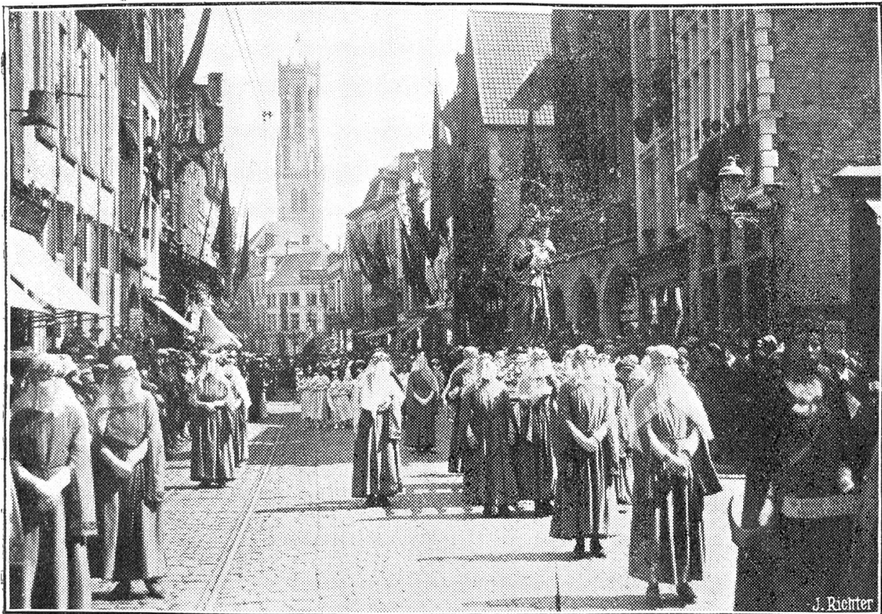
Die alljährliche, am Karfreitag stattfindende grandiose Prozession des „Heiligen Blutes“ in Bruges (Belgien)